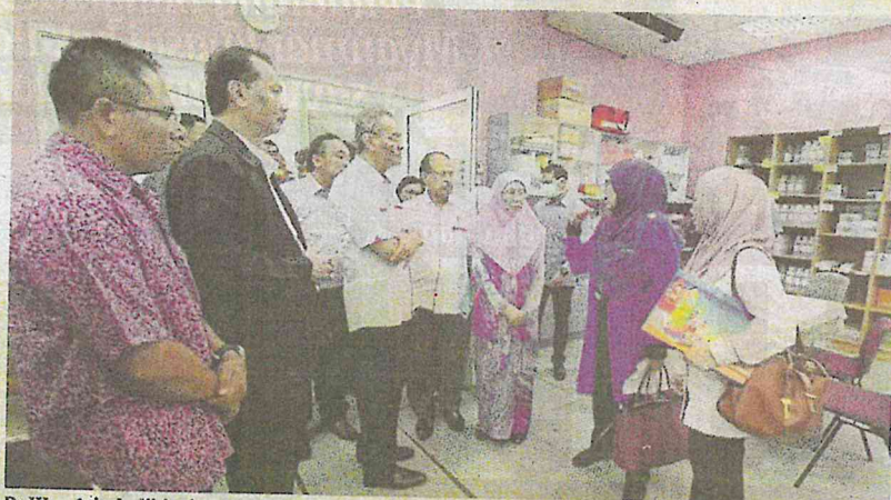
Dr Wan Azizah diiringi Menteri Kesihatan, Datuk Seri Dzulkefly Ahmad (tiga dari kiri) dan Ketua Pengarah Kesihatan, Datuk Dr Noor Hisham Abdullah (dua dari kiri) mendengar penerangan mengenai misi membawa pulang rakyat Malaysia dari Wuhan ketika melawat Unit Kecemasan Udara di KLIA, Sepang, semalam.