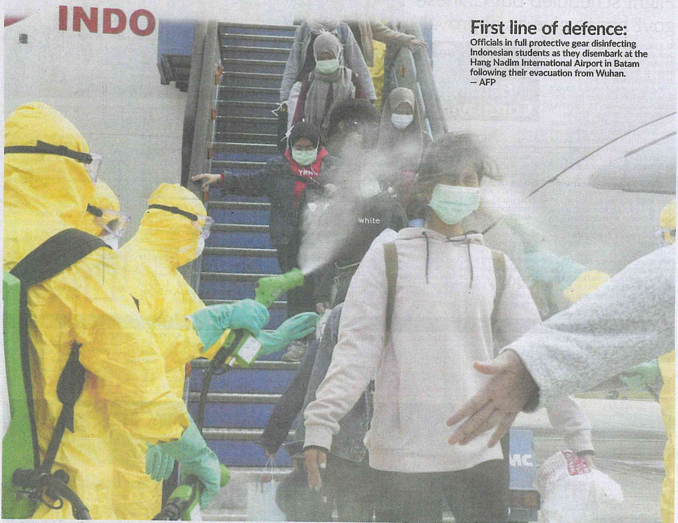
First line of defence: Officials in full protective gear disinfecting Indonesian students as they disembark at the Hang Nadim International Airport in Batam following their evacuation from Wuhan.

Malaysians stranded in Wuhan, the epicentre of the coronavirus outbreak, could return home at the soonest today. Putrajaya is ready to evacuate 132 people - 108 citizens and 24 foreigners related to them - under strict supervision. >2