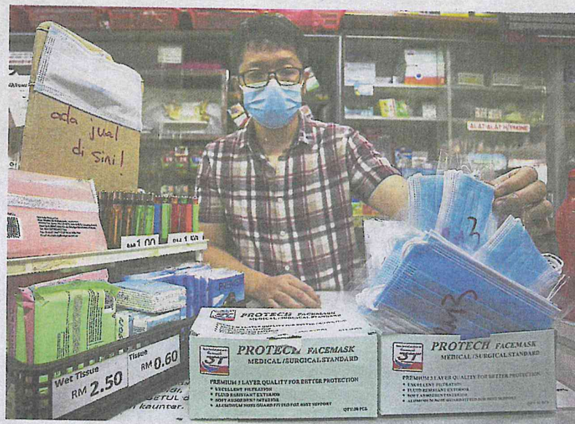
Safety first: A trader who only wants to be known as Wee showing face masks sold at his outlet near the Terminal One bus station in Seremban.

are not controlled items, so we cannot stop the public from buying in bulk.