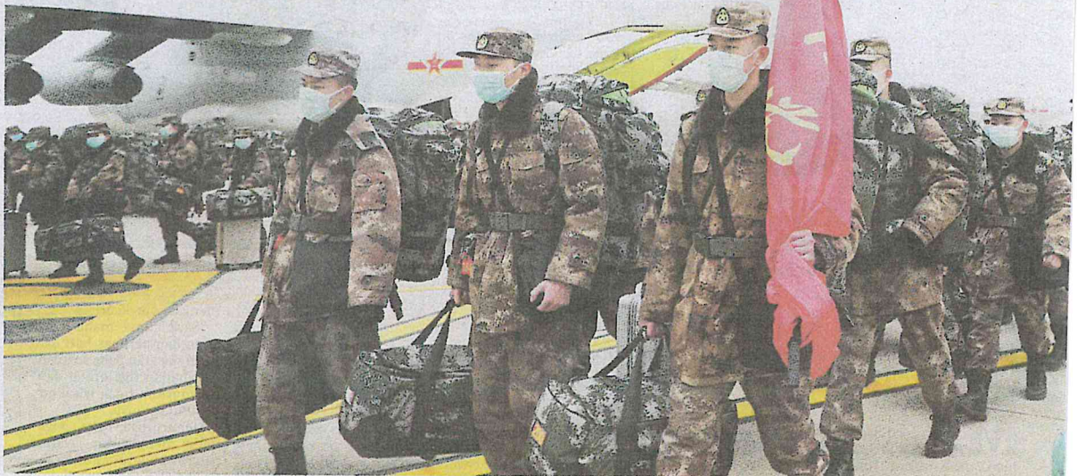
PASUKAN tentera China bersama pasukan perubatan tiba di Lapangan Terbang Antarabangsa Wuhan Tianhe untuk membantu melawan penularan wabak coronavirus baharu.

108 rakyat Malaysia, 24 bukan warganegara terkandas di Wuhan pulang hari ini